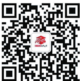
▲株洲晚报老年大学 微信公众号