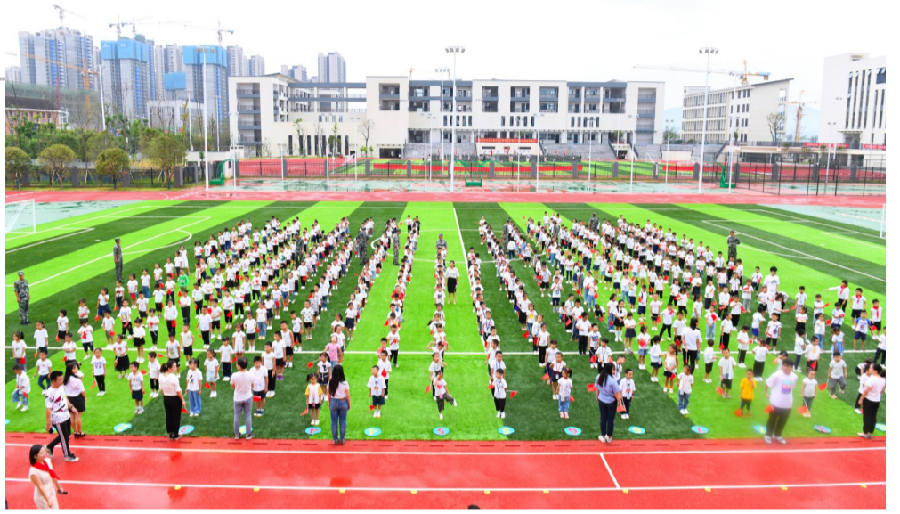
▲9月4日,隆兴小学的孩子表演《国旗国旗真美丽》

8月13日,侯先生来电反映,他8月3日在某摩托车专卖店买了一辆摩托车,价格2680元,商家承诺可以上摩托车黄牌照,但付款后商家一直未提供摩托车合格证资料。侯先生质疑摩托车排量不够上黄牌照,商家才不给合格证资料,请求维权。 芦淞区市场监管局庆云山所接诉后展开调查,商家称摩托车排量达到50CC以上,符合上摩托车黄牌照的排量条件,一直未提供摩托车合格证资料的原因是因跟厂家的货款纠纷导致厂家扣留这批摩托车合格证资料。执法人员指出,商家销售的商品情况应如实完整地告知消费者,这样隐瞒无法提供合格证的行为已经侵害了消费者合法权益,应当按照消费者要求退货处理并全额退还货款。最终,商家当场向侯先生道歉并退还货款2680元,侯先生退还所购摩托车。