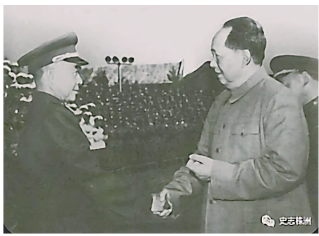
陈明仁与毛主席合影