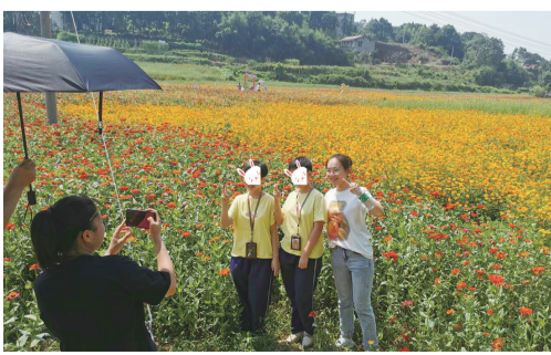
徜徉青龙湾花海。罗春娇 摄