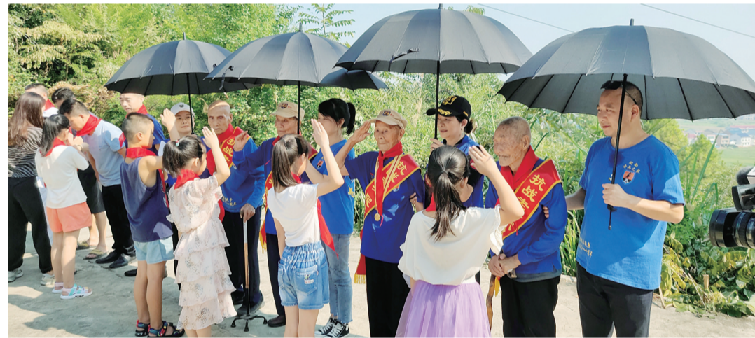
▲孩子们为抗战老兵系上红领巾并敬少先队礼

本报讯(记者 刘望 通讯员 左振华)8月31日,攸县4位参加过抗日战争的老兵来到攸县雷公仙风景区,在“抗日烈士纪念碑”前祭奠为抗战牺牲的革命英烈。