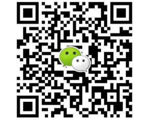
扫一扫上面的二维码加关注