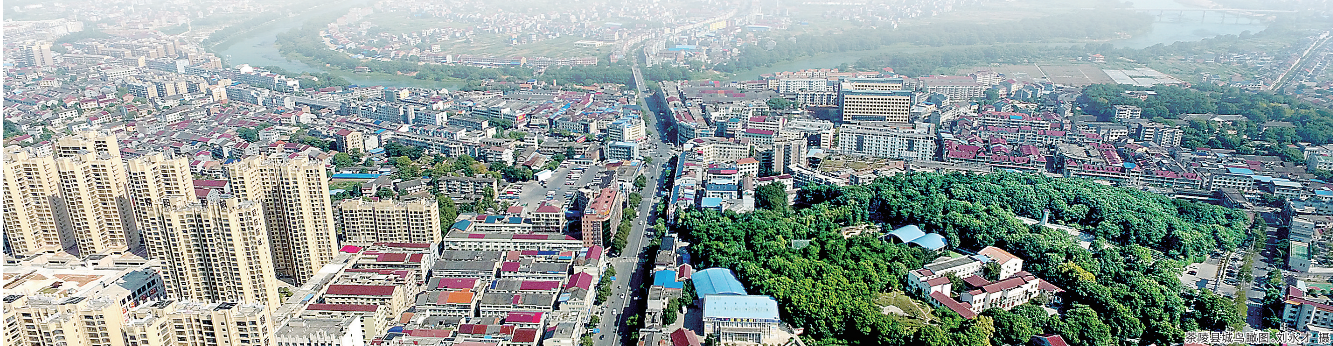
茶陵县城鸟瞰图