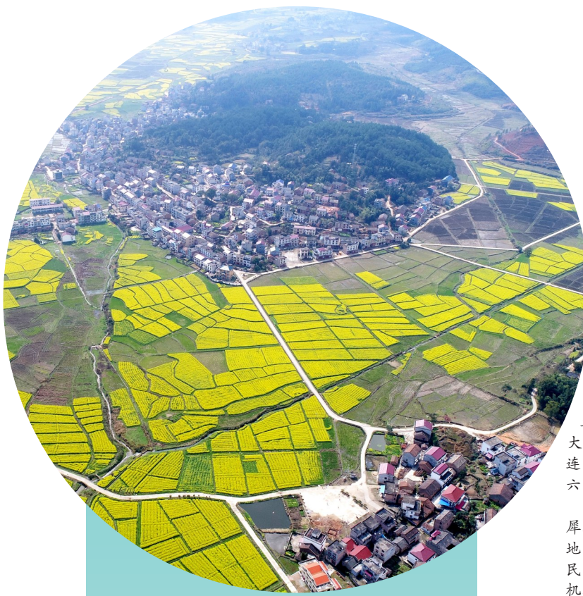
金色秀美的秋堂镇。