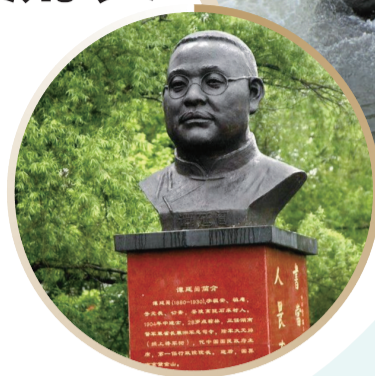
茶陵祖安中学内的谭延闿塑像。