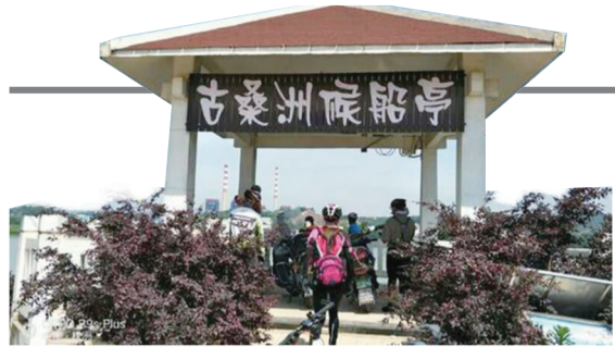
古桑洲候船亭,洲上的居民和观光的游人,都得通过渡船往来。