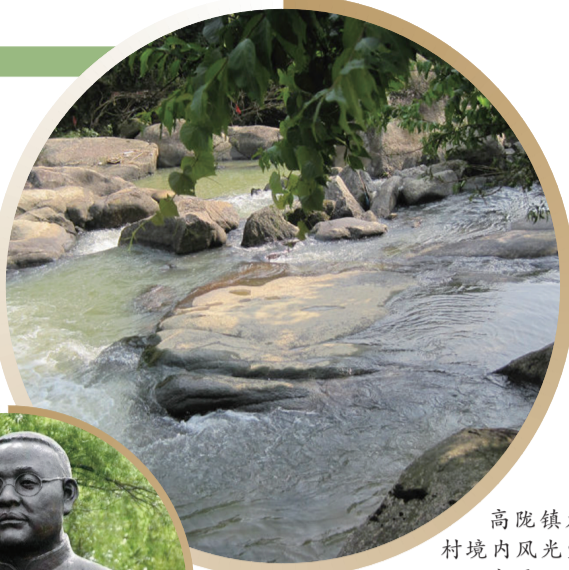
高陇镇龙臣村境内风光宜人的石窝潭。

高陇是一本书,只要你用心翻阅,一定会受益匪浅;高陇是一首诗,只要你懂得欣赏,一定会获益多多!