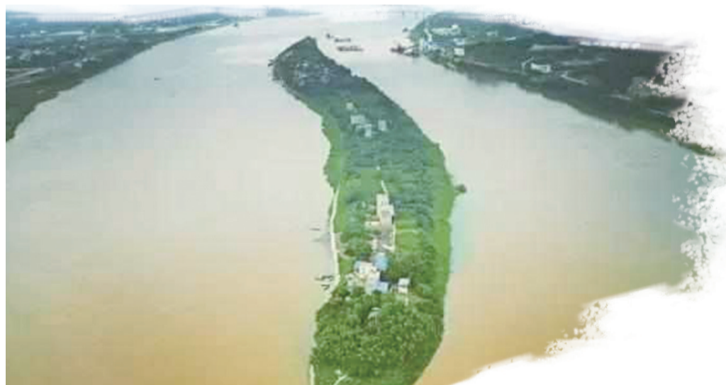
航拍古桑洲,形如一条湘江而上的大鲑鱼,故又有“鲑洲”之谓。