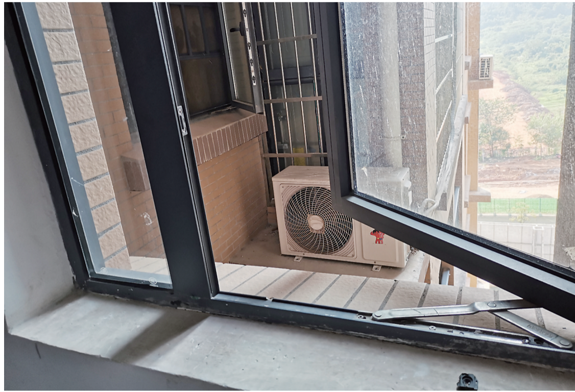
▲女童从5栋8楼过道窗户坠落的位置