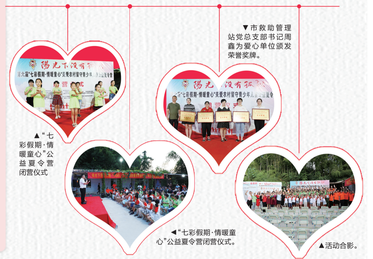
▲“七彩假期·情暖童心”公益夏令营闭营仪式

“社会各界志愿者为孩子奉献的是温暖,是真情,愿每一个孩子常怀感恩之心,争做有用之人,我们坚信在社会大家庭的支持和帮助下,孩子们的明天会更加美好。”周鑫表示。