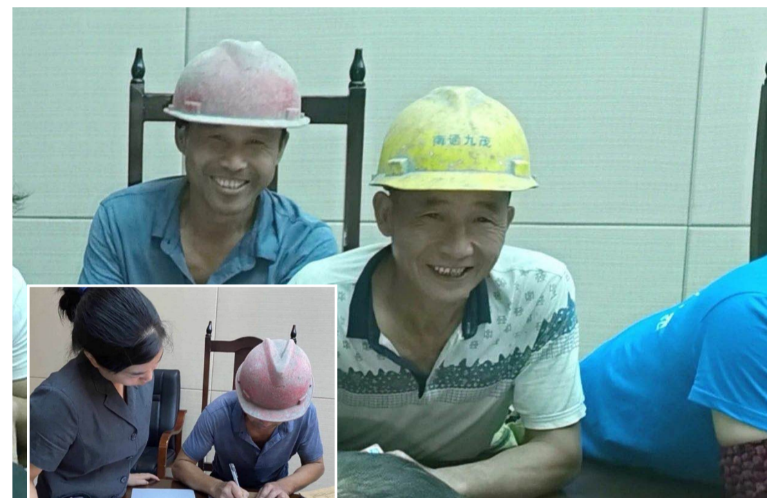
▲兑现大会现场,农民工喜笑颜开