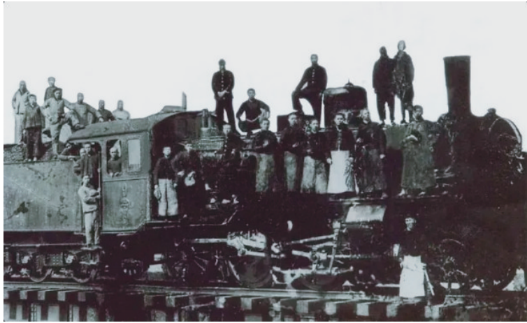
1922年株萍路矿工人俱乐部筹备委员会在南站合影