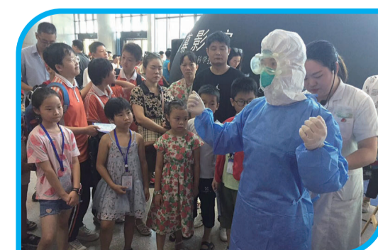
▲株洲市二医院(株洲市肿瘤医院)医务人员讲解防护服穿着事项

本次活动由株洲市科学技术局、中共株洲市委宣传部、株洲市教育局、株洲市卫生健康委员会、株洲市科学技术协会、云龙示范区管委会、株洲日报社主办,株洲云龙示范区工信科技局、株洲日报社校园记者俱乐部、市人工智能和大数据产业链办承办,湖南管鲜森农业文化传播发展有限公司、株洲湘江文化传媒有限公司执行承办;感谢湖南省科技馆、湖南省化工职业技术学校、云龙水上乐园、沙坡里农产品深加工有限公司、湖南猕恋生物科技股份有限公司、湖南有色金属职业技术学院、株洲南方航空高级技工学校、湖南汽车工程职业学院、株洲人工智能职业技术学校、华升教育培训学校有限公司、株洲长郡云龙实验学校等单位给予的大力支持。