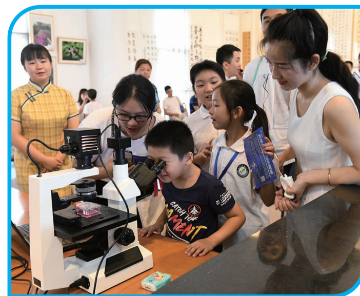
▲在工作人员的帮助下,学生观看显微镜下的世界