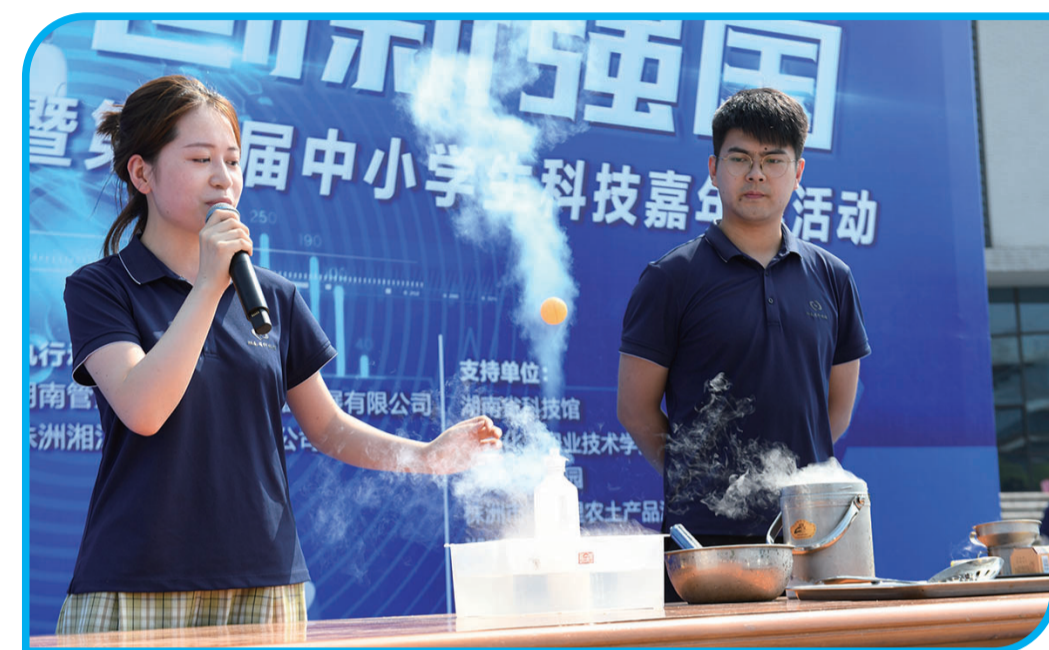
▲湖南省科技馆工作人员在舞台上演科技秀