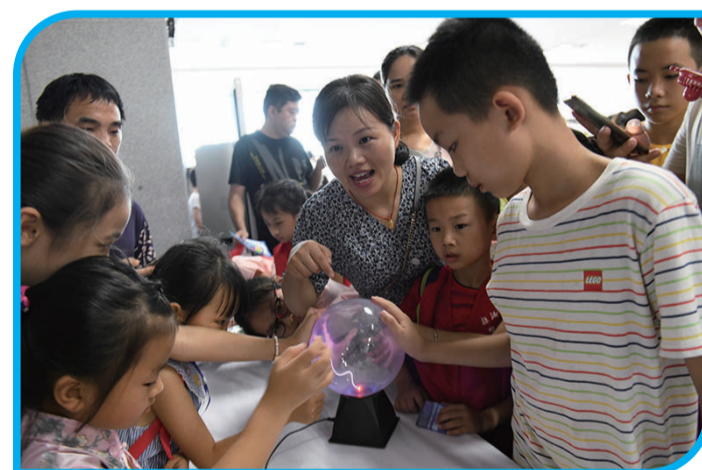
▲触摸静电球,产生电弧