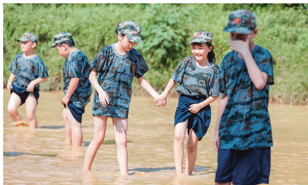
▲户外捕鱼现场,小朋友脱下鞋子,挽起裤脚,光着脚丫,进泥塘捕鱼

本报讯(记者 何春林 通讯员 邹双林)前日上午,美的物业公司向晚报驻美的城小区群记者分享了他们创新做法:为丰富所服务小区的儿童的暑期生活,培养孩子们独立、自主能力,8月22日至25日,他们组织开展了暑期少儿夏令营活动。