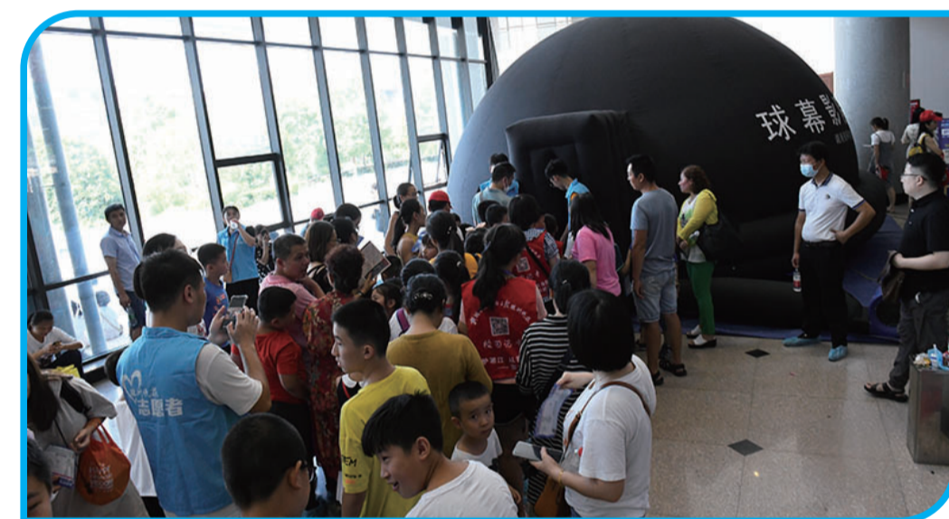
▲湖南省科技馆的“球幕影院”深受孩子欢迎