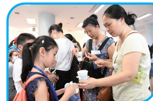
▲校园记者和家一起动手制作“旋转纸灯”