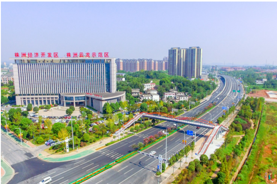
▲8月28日,洞株城际快速路全线通车

华新机电基于多年港口物流起重运输装备行业的经验,近年来不断推动公司党建工作落实,以抓好党的建设各项工作引领科技创新发展,积极推动产、学、研、用协同创新,通过激光扫描系统、专家工艺系统、安全保护及定位系统、远程操控系统、MIS信息管理系统等关键技术的开发,致力提升国内外大型港口信息化和智慧化水平。通过结合物联网、大数据、云计算等新技术,对原有设备和技术实施智能化改造,使其安上智能的“大脑”,接上互联网的“云端”,推进生产方式“智造”,产业形态再造,高端产业创造,加快培育形成智能制造新模式,为推动产业跃上中高端水平助力,为终端客户产业升级、行业升位、效益升华提供技术保障。(通讯员 施永昌)