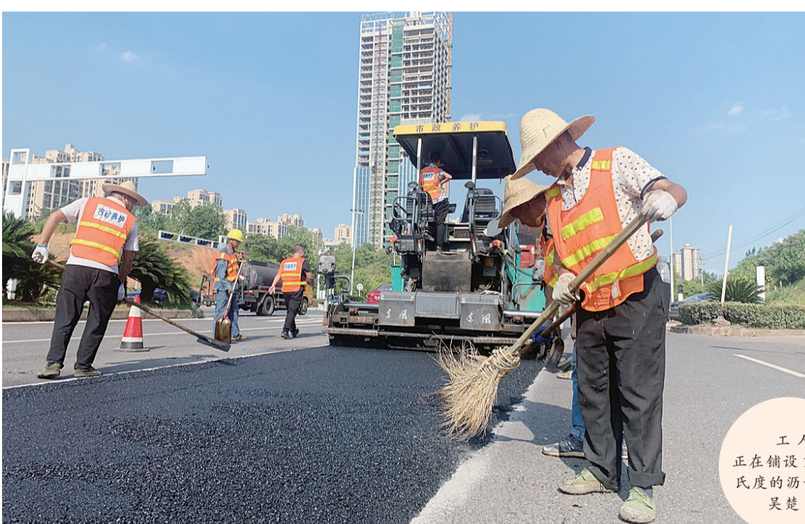
工人们正在铺设150摄氏度的沥青。