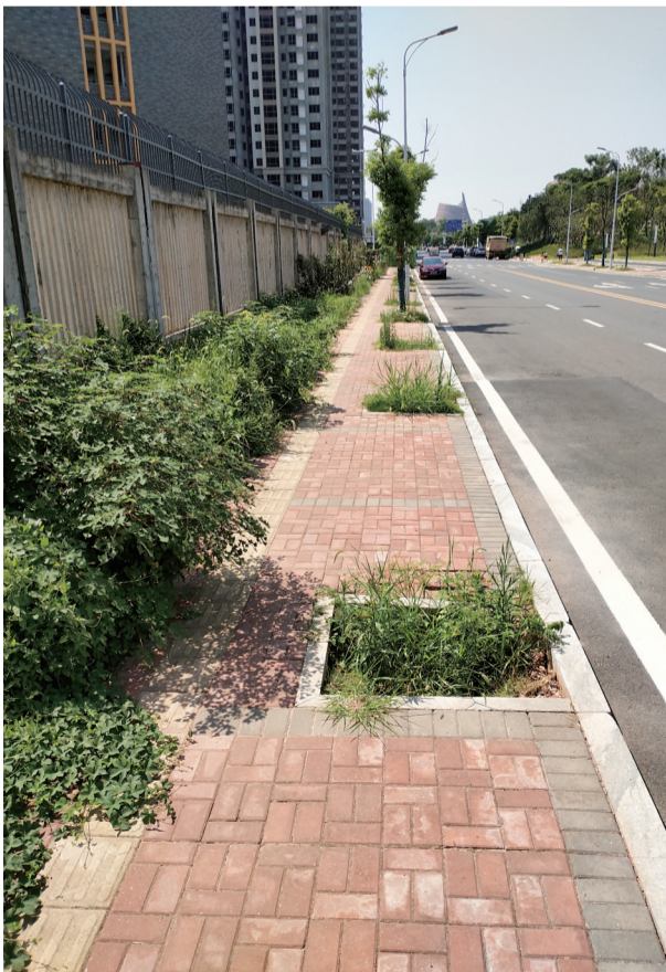
▲连续三个树池出现缺株,里面杂草丛生

随后,记者就森林路违规种菜的情况,反映给天元城管部门。负责接线的工作人员表示,他们会马上安排人员前往现场进行处理。