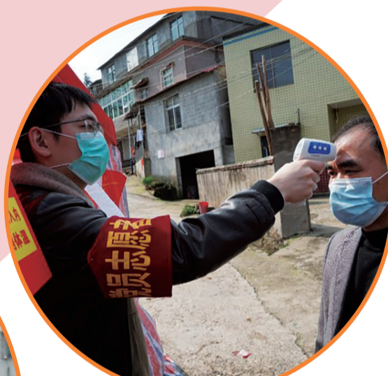
▲税务干部下沉一线积极防控疫情。

6月中下旬，株洲市税务局的青年志愿者们来到天元区高格小学和栗雨小学，为两校四、五年级的小学生们带来了一场精彩的税收知识课。