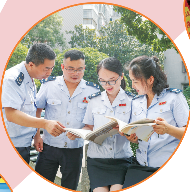
▲株洲市税务局第一稽查局干部在进行业务探讨。

6月中下旬，株洲市税务局的青年志愿者们来到天元区高格小学和栗雨小学，为两校四、五年级的小学生们带来了一场精彩的税收知识课。