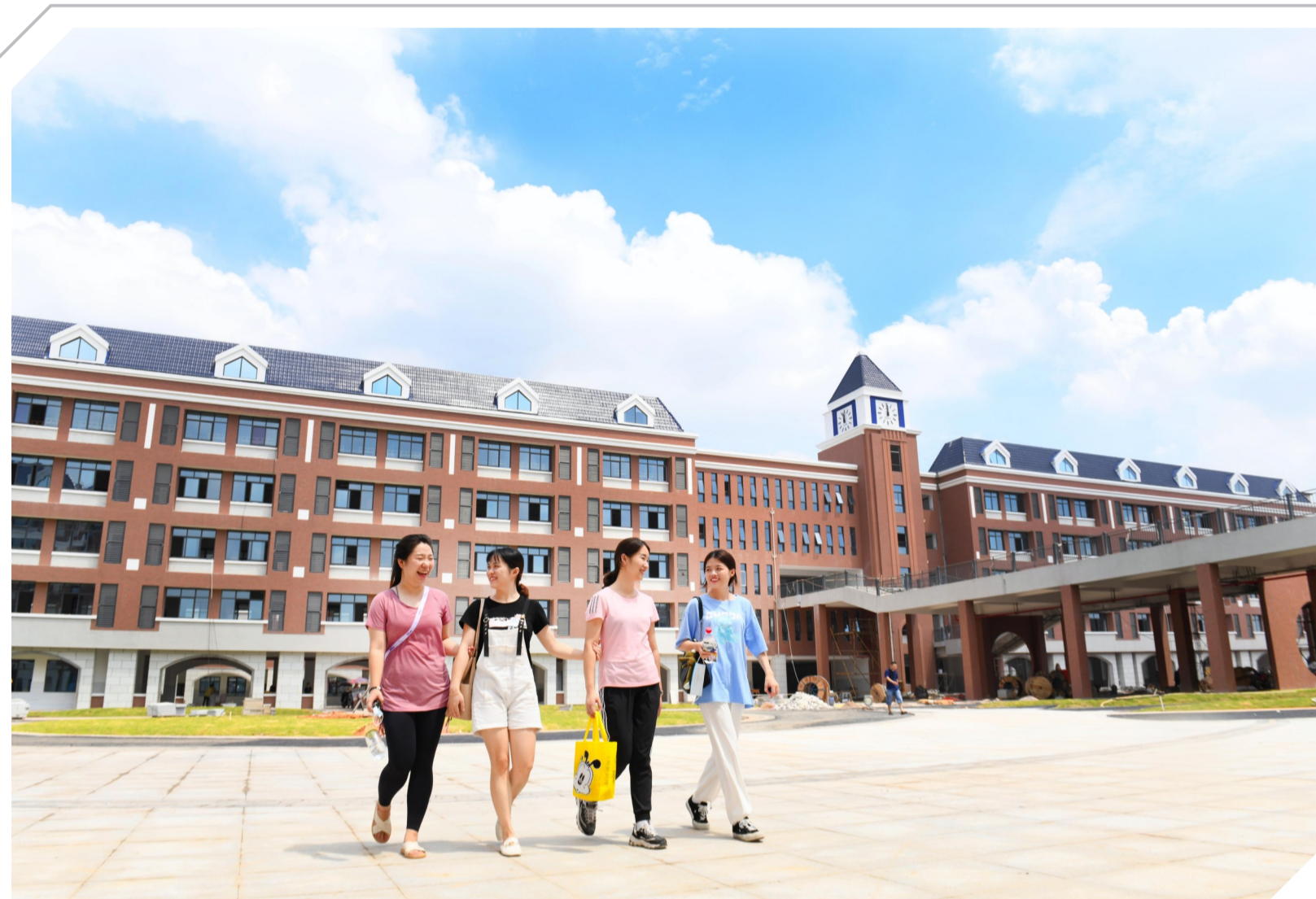
▲老师们走进崭新的二中附小为开学做准备,该校规划学位3240个

隆兴中学、隆兴小学、白鹤菱溪小学、二中附小 二中青龙湾小学、香江学校、长郡云龙实验学校 七所新学校 即将迎新