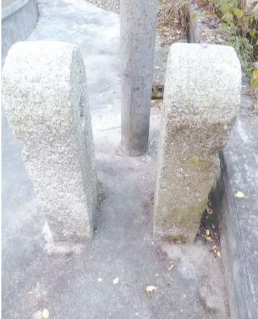
当年安放石牌坊的石墩子底座