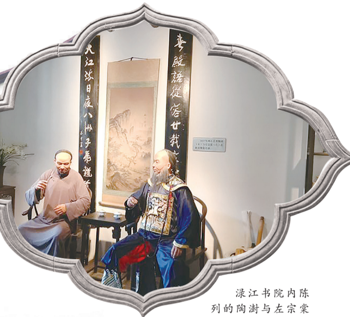
涑江书院内陈列的陶澍与左宗棠深夜交谈的蜡像