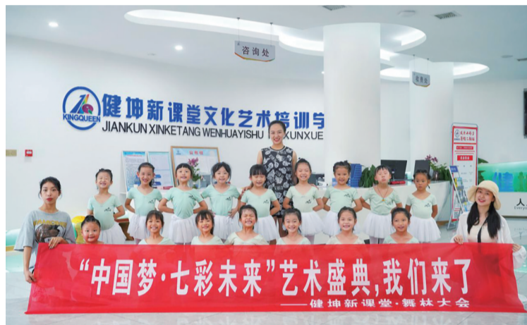
舞林大会的16名小选手在“第十五届中国梦青少年儿童艺术盛典”中荣获金奖,将代表湖南赛区赴上海参加总决赛。

今年暑假,健坤新课堂文化艺术培训学校的学员们很忙,但收获颇丰。舞林大会、迎风跆拳道、唐朝打击乐架子鼓课程的学员们,通过坚持不懈地努力,终于站上领奖台,赢得了属于自己的荣誉。