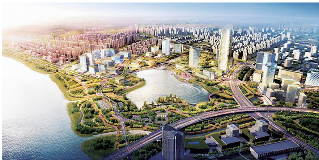
清水塘城市公园效果图