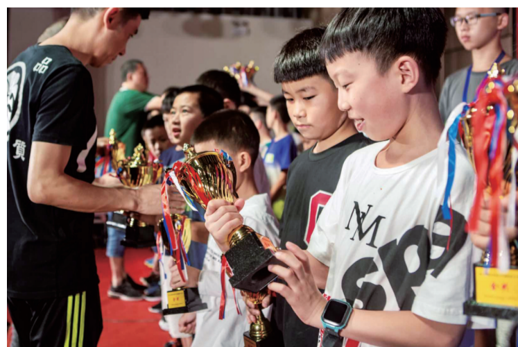
唐朝打击乐架子鼓派出了27名小选手参加“第八届湖南省青少年鼓手大赛”,取得3金、13银、11铜的好成绩。