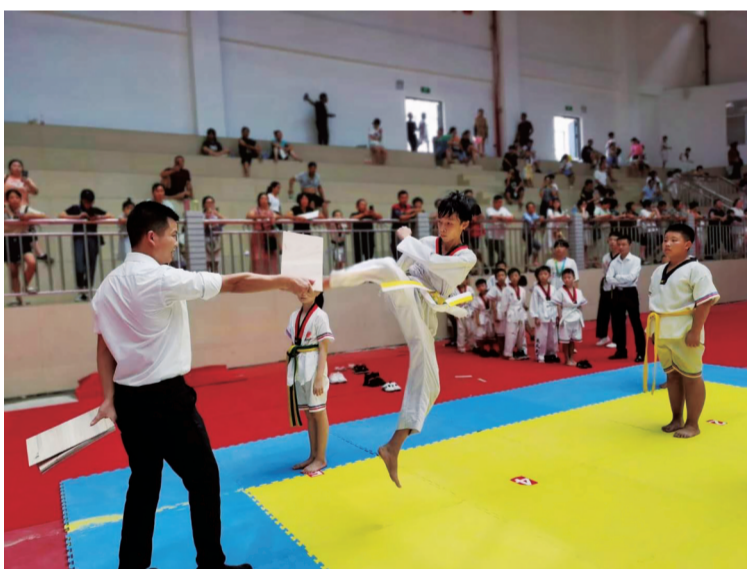
迎风跆拳道共有33名学员参加考级,22人荣获白黄带、3人荣获黄带、6人荣获黄绿带、2人荣获绿带,通过率达100%。