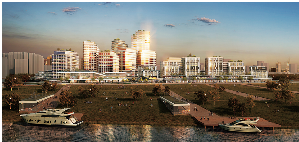
绿地项目滨江效果图

融产业、商业、生态于一体,绿地智慧生态城,位于清水塘生态科技新城的科创研发板块,总规划面积约2.6平方公里,规划有高新科技产业、3万方国际商业中心、甲级商业办公写字楼、高端酒店、科技智创公寓以及第四代人居住宅,全维度人居覆盖,缔造和革新着株洲超乎想象的未来图景,构建株洲人居全新华章。