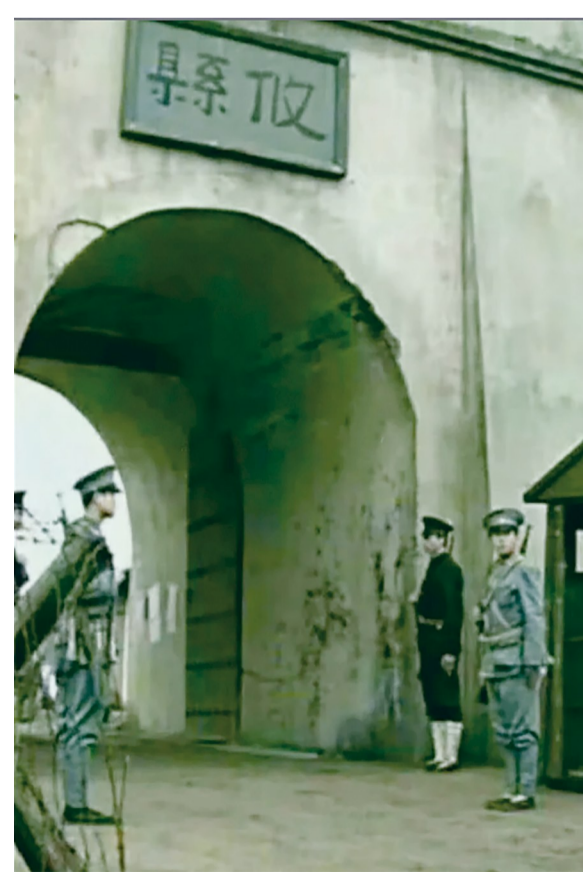
县城十字街和老衙坪都在攸县城内

如此盘点下来，为什么古代没有现在的技术和材料，但建筑质量有保障，已经了然于目了。记住，无论哪一条，背后都有严格的问责相匹配。被技术和材料冲昏了头脑的现代人，何不谦虚一点，向古人学习一下呢？