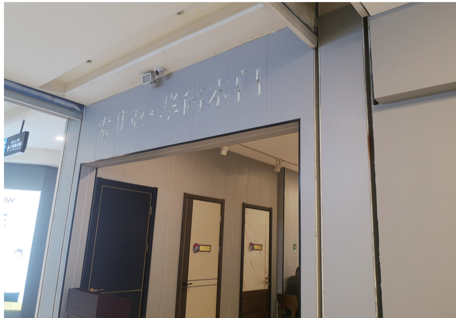
▲陈老板的店铺外景