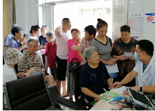
活动现场

活动现场,株洲市三三一爱尔眼科医生用通俗易懂的语言,向社区老年朋友介绍了常见的白内障、沙眼等眼部疾病的症状及表现,重点阐述了这些疾病的危害、治疗方法以