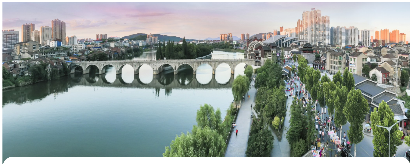
渌江河醴陵城区段,“水清、河畅、岸绿、景美”。