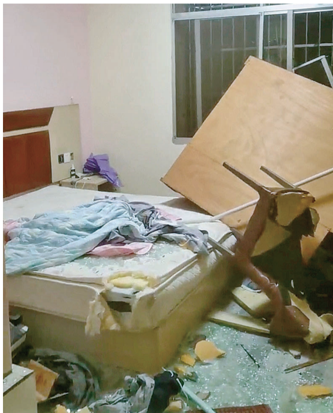
▲宾馆房间内的设施被黄某暴力破坏

本报讯(记者 李卉 通讯员 魏天宇)“咚咚咚……”深夜,宾馆房间传出剧烈的声响,引起其他住客的不安。工作人员发现门已反锁,到场的民警决定强行开门。