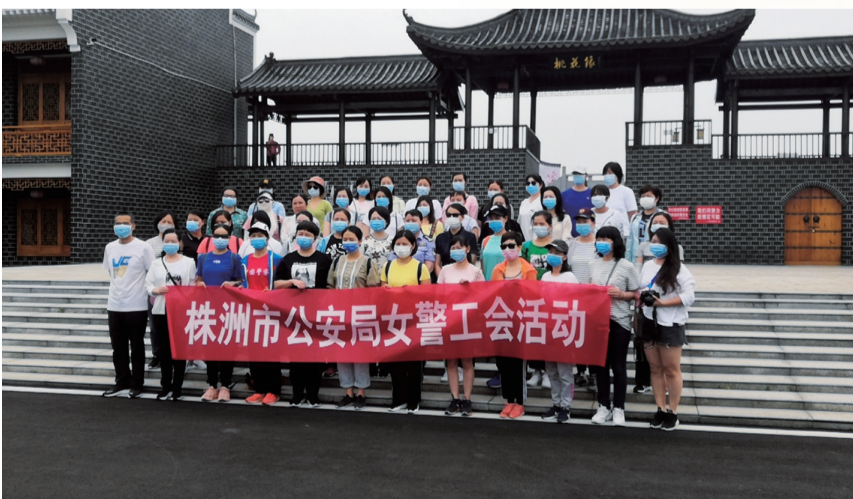
市公安局工会组织“战疫情·登山健步行”活动。

通过“活力健康警队”建设,民警的凝聚力增强,民警的履职能力和水平有了较大提高。据统计,近年来,株洲治安状况持续向好,刑事立案数、八类恶性案件立案数等大幅下降,市民的安全感、幸福感与日俱增。