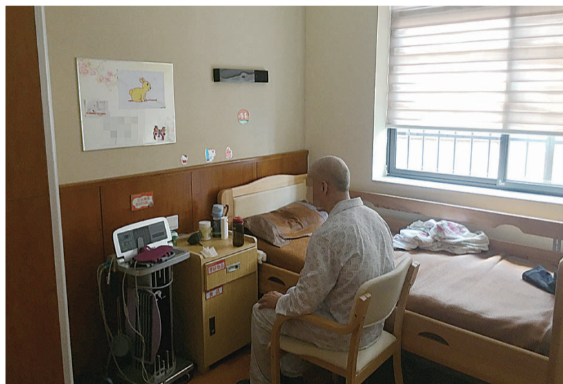
▲一位老人在芦淞区一家民建公助的街道养老中心生活