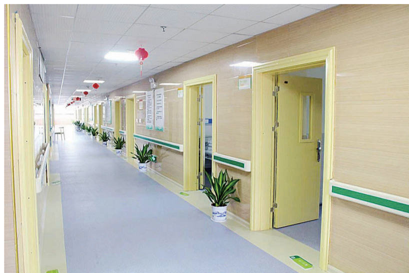
▲荷塘区一处新开放的民营医养服务中心,是由医院改建而成的