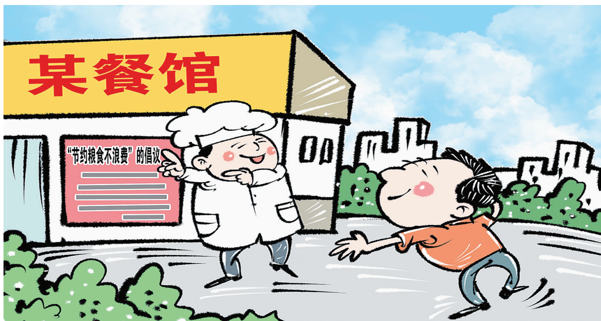
漫画:倡导节约 新华社发 商海春作