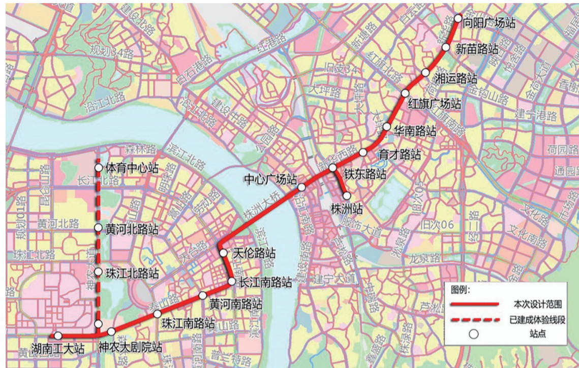
▲智轨一期站点示意图

本报(记者 戴凜 通讯员 夏四亮)记者昨日从市交通运输局获悉,我市智能轨道交通系统一期工程