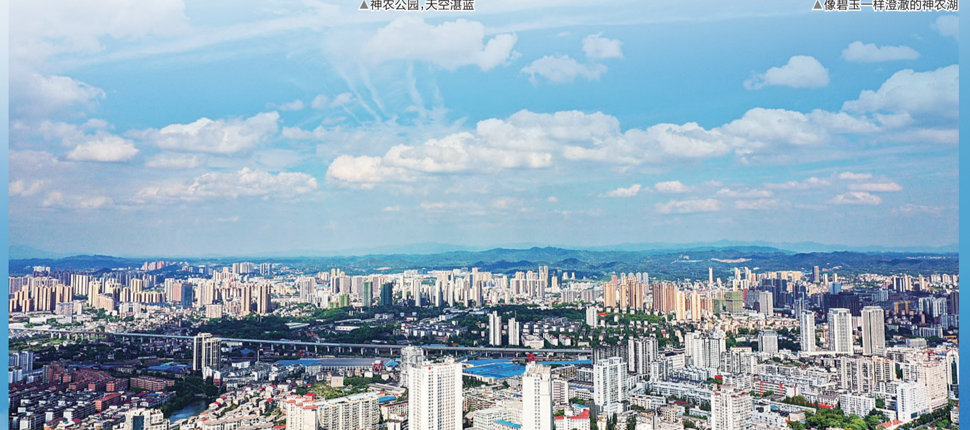
▲荷塘区上空，白云朵朵