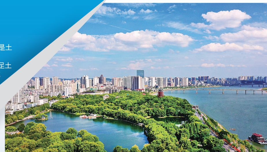
▲神农公园，天空湛蓝