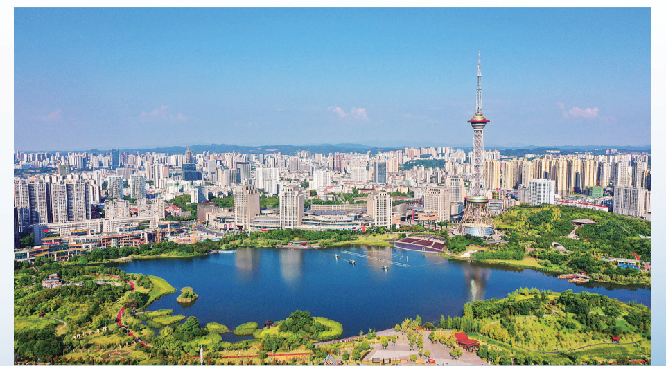
▲像碧玉一样澄澈的神农湖