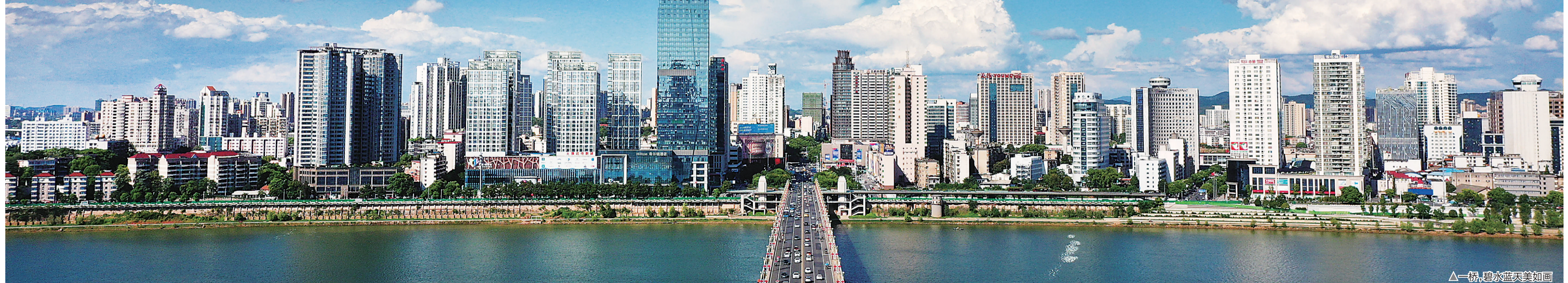
▲一桥，碧水蓝天美如画