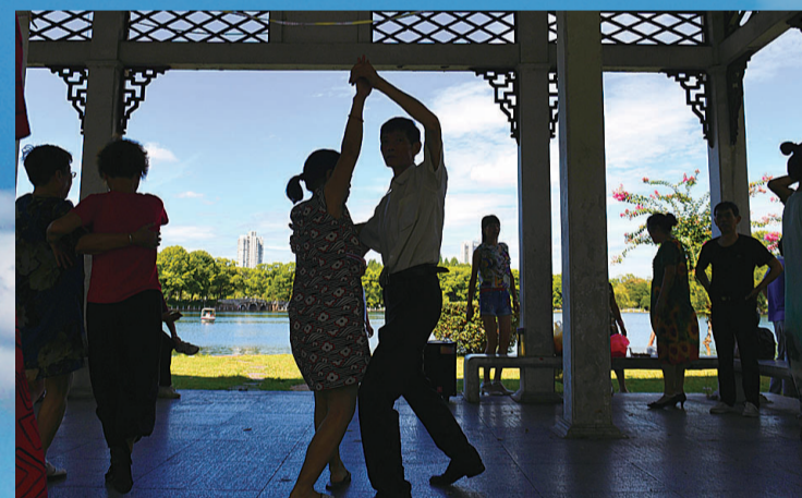
▲神农公园，美好的环境带来美好的生活