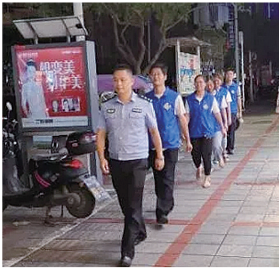
▲民警带领“蓝马甲”志愿者巡逻