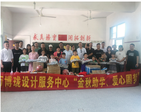
▲爱心人士在兴隆小学与孩子们合影

随后,一行人又上门慰问了该校五年级贫困生小文。万博琰设计服务中心为小文捐赠了1000元助学金。