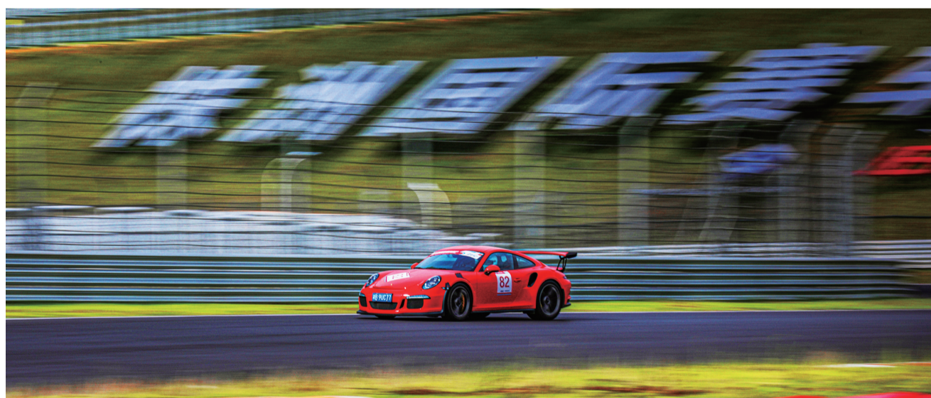
一辆赛车,从株洲国际赛车场的大字下面飞驰而过。