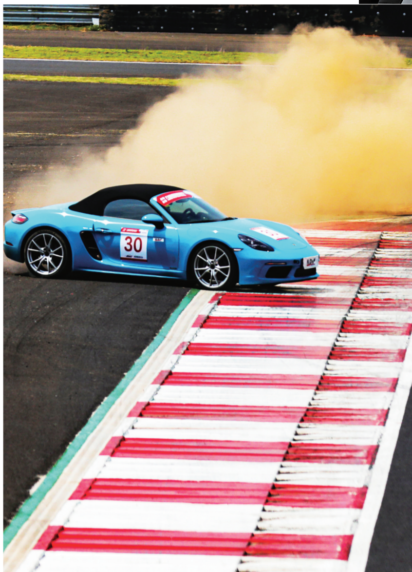
入弯速度过快冲出跑道,这对初次进入赛道的爱好者来说是常事。