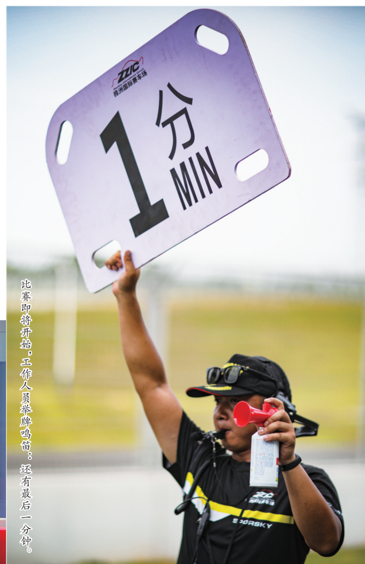
比赛即将开始,工作人员举牌鸣笛,还有最后一分钟。