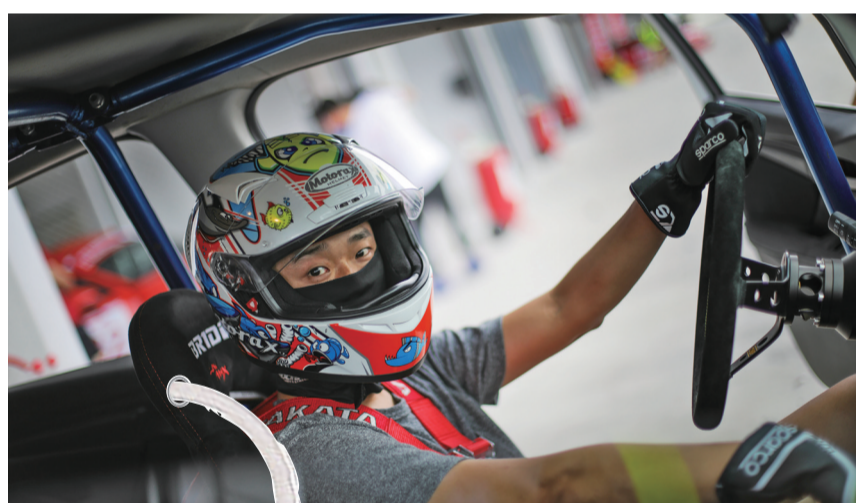
一位车手驾驶自己的车去维护,为比赛做准备。