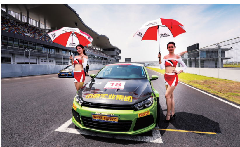
比赛余兴节目就是跟模特拍照合影。