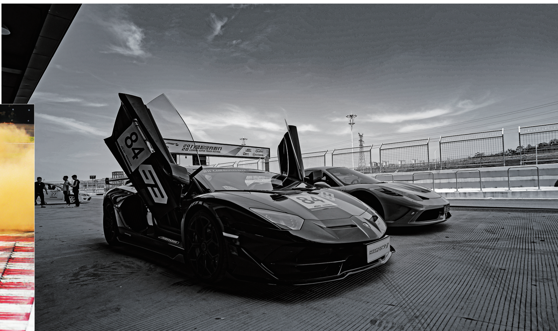
今年4月,株洲国际赛车场迎来第一场比赛,一辆剪刀门跑车供大家拍照留念。