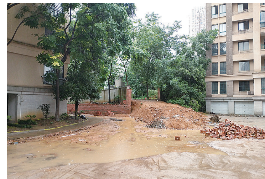
▲散户区土路延伸到小区内部,给小区环境和安全带来影响

近日,家住尚格名城小区的业主胡女士拨打晚报新闻热线28829110投诉:最近我们小区砌围墙,遭到周边几户散户阻工,双方还差点发生肢体冲突,希望晚报记者能过来帮帮我们。