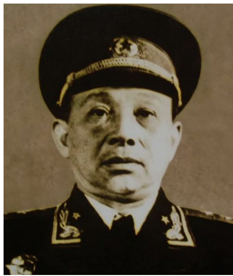
谭家述:茶陵县人,1955年被授予中将军衔。

湘南独立师建立之初,王震、谭家述这一对好搭档于11月26日率领原本计划攻打萍乡的部队主动出击皇图岭,一举取得了皇图岭大捷。