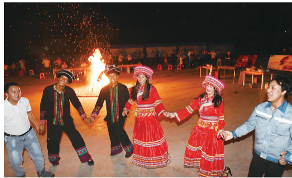
▲火把节活动中,大家载歌载舞

火把节又被称为星回节,是彝族、白族、傣族等多个少数民族重要的传统节日。在点火把、拜祭火把的过程中,一些老人会默念“烧死跳蚤,烧死老鼠,烧死魔鬼,烧死一切害虫”,期盼五谷丰登、六畜兴旺。