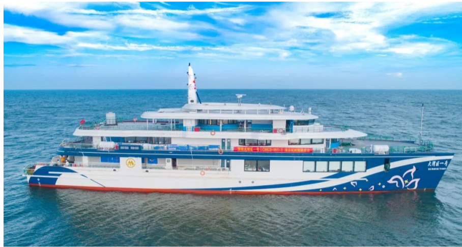
▲“大湾区一号”豪华观光游船顺利交付

本报讯(记者 伍靖雯 通讯员 邓建华 姜杨敏)8月14日,“大湾区一号”豪华观光游船在深圳正式亮相交付。这艘游船搭载了由中车株洲电力机车研究所有限公司与招商局工业集团联合开发、具备完全自主知识产权的2MW级船舶直流组网电力推进系统装置。其成功交付,意味着我国高端船舶“中国芯”的商业化之路,迈入新的阶段。