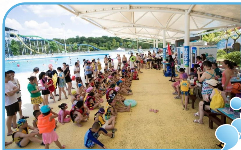
▲校园记者了解急救知识