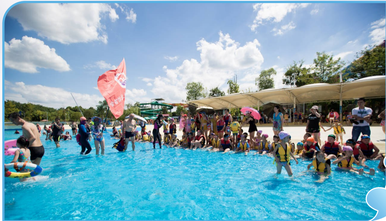
▲校园记者在云龙水上乐园的造浪池中尽情游戏