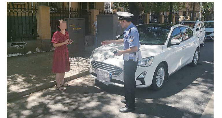
▲司机故意遮挡号牌被交警查获

本报讯(记者 刘玺 通讯员 管丽)司机去吃早餐,将车辆违停在路边又担心被电子警察抓拍,便故意遮挡号牌,被荷塘交警大队查获。