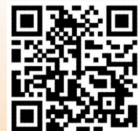
▲扫描上方二维码看活动视频