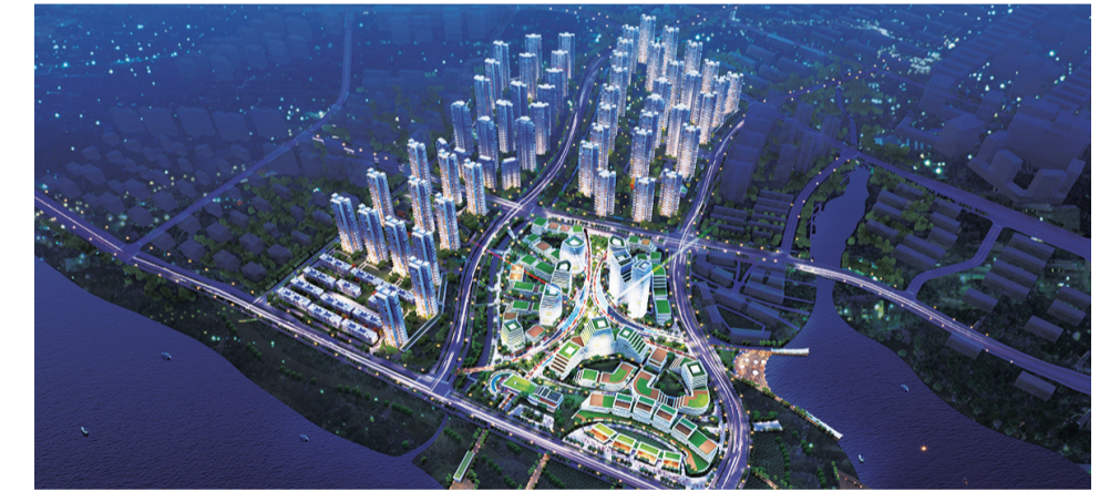
▲绿地智慧生态城项目鸟瞰夜景

“三年腾出空间、六年大见成效、十年建成新城”。按照这一总体目标,清水塘正在阔步前进。