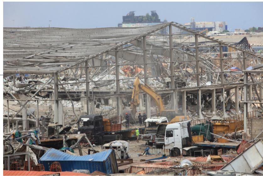
▲8月13日,工作人员在黎巴嫩贝鲁特港口区进行清理作业

专家表示,在深化利率市场化改革的进程中,存量房贷“换锚”给了客户一次选择权。银行应充分调动自身资源和力量,提升精细化服务水平,确保客户知情,并维护客户选择的权利。在市场化、法治化原则下,银行应充分尊重不接受批量转换客户的选择,与客户协商解决。同时,建议存量房贷客户及时作出明确选择,充分使用自身选择权。(据新华社)