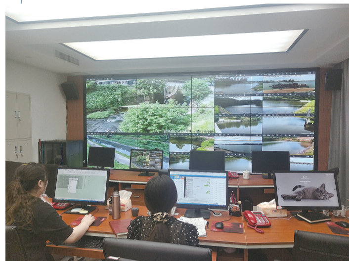
石峰区可视化智慧河湖监控平台。

该区依托网格化信息平台，坚持以河湖问题为导向，以“一单四制”为抓手，由区网格化管理服务中心统一整理智慧河湖监控系统发现的问题，建立问题台账同步更新数据，通过网上交办问题，初步实现所有河湖问题动态监管全覆盖、无死角，问题交办、治理、销号、情况通报全网全过程动态数据实时更新，力争打造全市第一个动态立体智慧河湖示范区。