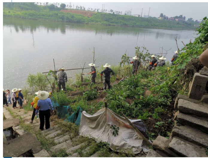
涑水涑口镇段清淤现场。

退田还河过程中，该区反复强调，要求“不可与群众发生冲突”“社区干部要走在前面继续做好政策解释工作”“不可一味破坏菜田，要帮助居民将菜整齐采好搁置一旁”等。截至目前，涑水北岸3.5公里河岸已完成清理，共清理菜田40余亩，同时护坡建立、污水治理、植树复绿等一系列工作相继开展。