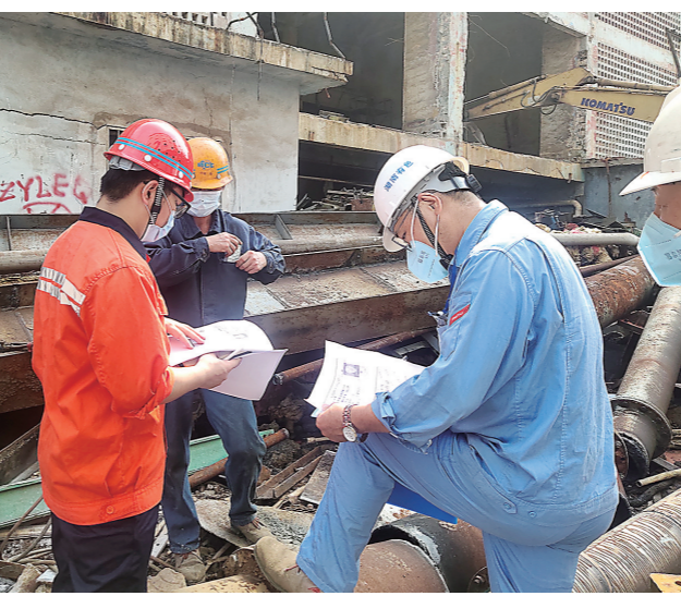
株冶设施设备拆除施工现场,安全环保检查组工作人员正在检查作业人员持证上岗情况。