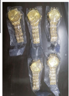
▲团伙用于实施诈骗的手表

本报讯(记者 李卉 通讯员 魏天宇 实习生 唐甜)商家免费派发手表,交300元押金还可以参与抽奖,然而每次抽中的都是“5号”……如果你这段时间在火车站附近遭遇过这样的街头诈骗,可以马上联系芦淞警方建宁派出所报案。