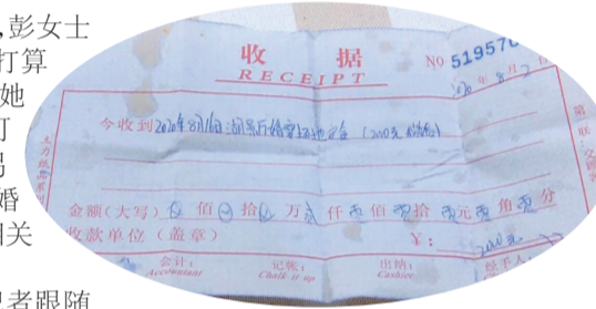
▲彭女士缴纳2000元定金的收据

为解决这个问题,彭女士提出解决问题的方案。经沟通,湖景酒店选择寻找同档次酒店。彭女士表示,超出了他们预算的部分,应该由酒店负责。而酒店方表示,彭女士太挑剔,才导致婚宴场地无法确定。上周五,酒店方表示,退还2000元定金不再接受协调了。