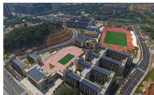
长郡云龙实验学校校园全景鸟瞰图。