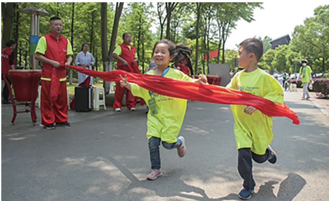
▲2017年毅行,两个小伙伴坚持走到了终点

徒步湘江环保毅行,其公益性在株洲“孩子圈”的影响越来越大。2018年的毅行,石峰区先锋小学一年级一班30多名孩子排成“小火车”队伍,一边唱读古诗一边前行。2019年的毅行,景弘中学初一-1817班的30多名学生,集体参加