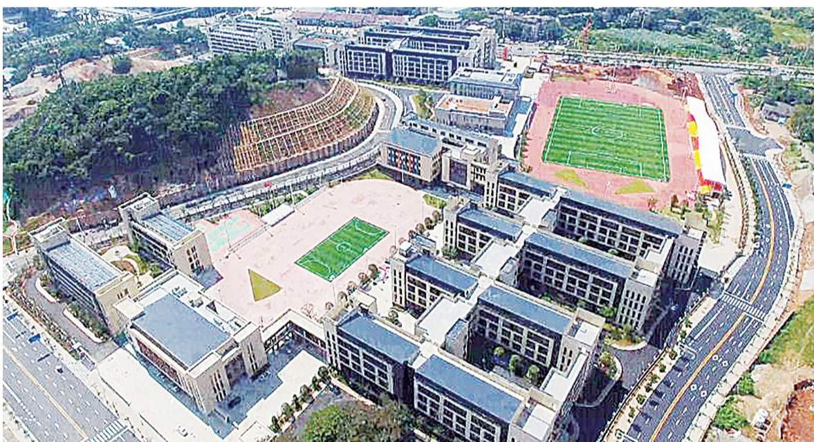
即将投入使用的长郡云龙实验学校。