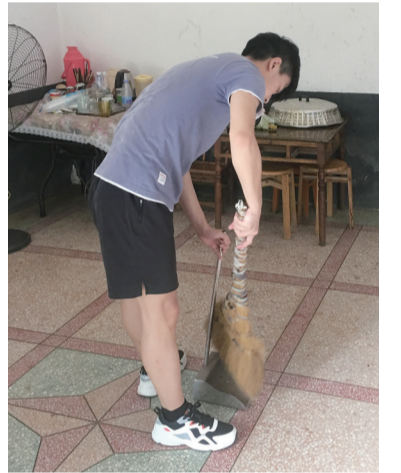
▲孝顺的小强在家帮妈妈打扫卫生

谢女士介绍,她每个月都要吃药、激素治疗,还失去了劳动能力。“由于患病多年,我的身体状况不太好,现在有高血压,肾功能也受了损,每个月吃药都要花费1500元以上。”谢女士说,有时实在承担不起