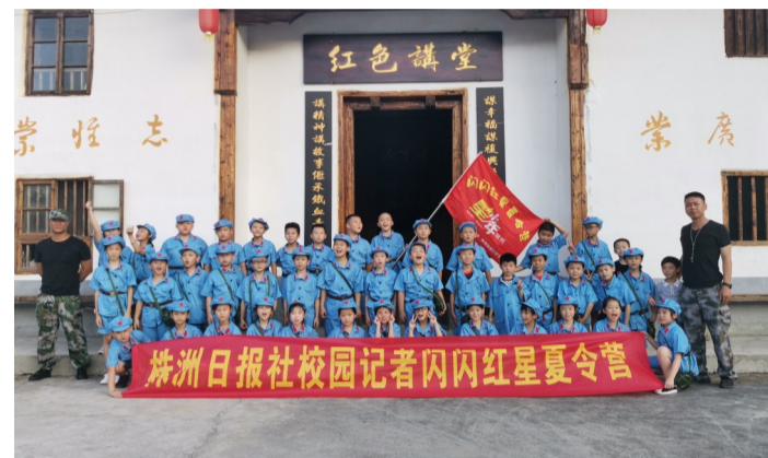
▲第二期闪闪红星夏令营营员合影

8月3日至7日,株洲日报社校园记者俱乐部开展了红色研学旅行系列活动之“闪闪红星夏令营——我是一名小红军”(第二期),33名校园记者在炎陵体验“小红军”生活,在红色文化中历练成长。