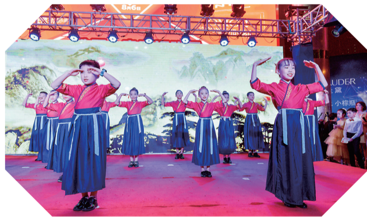
▲国学礼仪课环节,校园记者以新颖有趣的形式展现传统文化