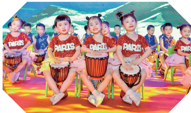
▲体育课环节,来自北京红缨株洲康馨幼儿园的天使记者演奏非洲鼓