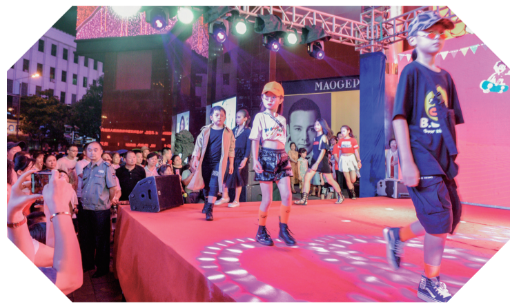
▲时尚课环节,校园记者“秀台步”显专业