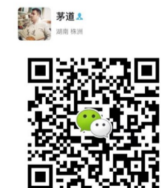
扫一扫添加官方微信,添加微信

如若你也有这样的食物,或者曾吃过这样的食物,请扫码下图二维码,添加微信与我分享。我相信,这些酸甜苦辣的记忆片段,就是我们共有的聚散离合的烟火人间。