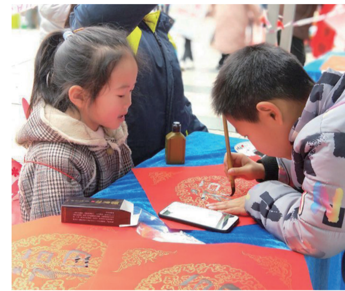
▲去年晚报社区嘉年华活动,一名小学生在写毛笔字(资料图)