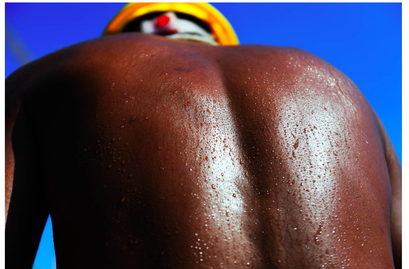
▲一名建筑工勤黑的背上布满了汗珠

同时,天元区市场监管局还将对网络销售、广告监管等严格监管,对违规行为严格稽查,依法从重予以查处。