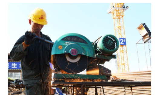
▲钢材切割现场火花四射