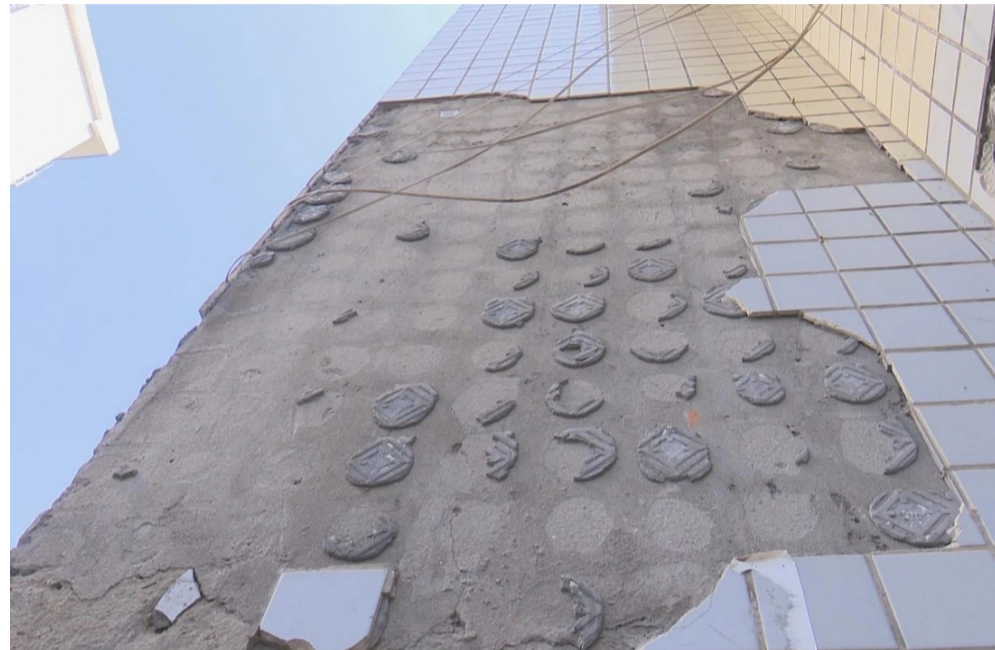
▲瀚水栗源小区外墙瓷片脱落严重

本报讯(记者 陈驰)车顶天窗玻璃被小区外墙掉落的瓷片砸裂,按照物业公司的要求先去修了车,可到报修时遭到推脱。这事就发生在天元区瀚水栗源小区,车主谢女士多次拨打市长热线反映,希望相关部门能介入,不仅是为了修车费用的问题,更是为了小区居民的安全。