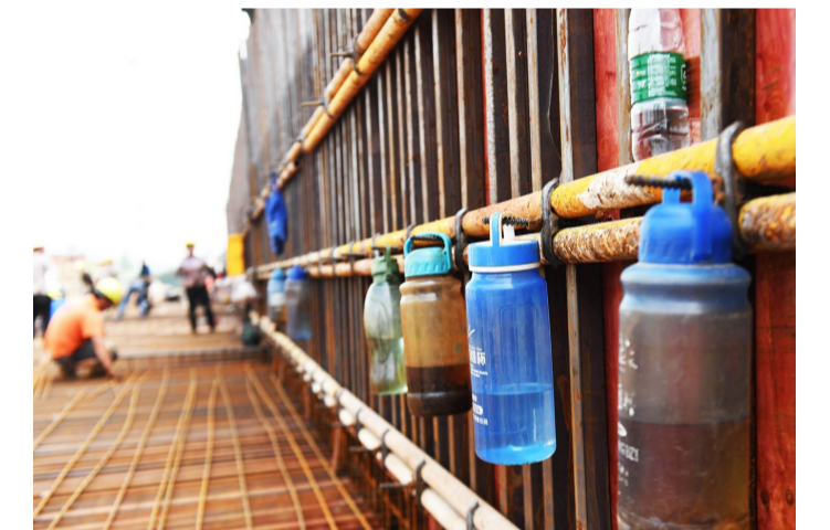
▲高温下作业的工人需要及时补充水分