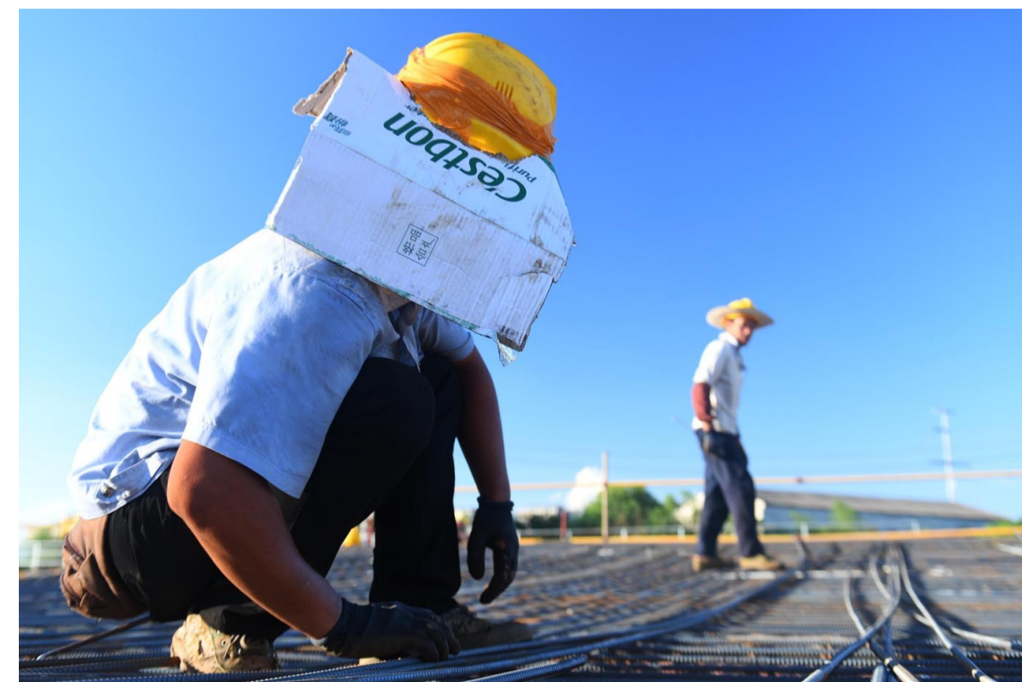
▲就地取材,把废弃的纸箱套在安全帽的两边挡太阳