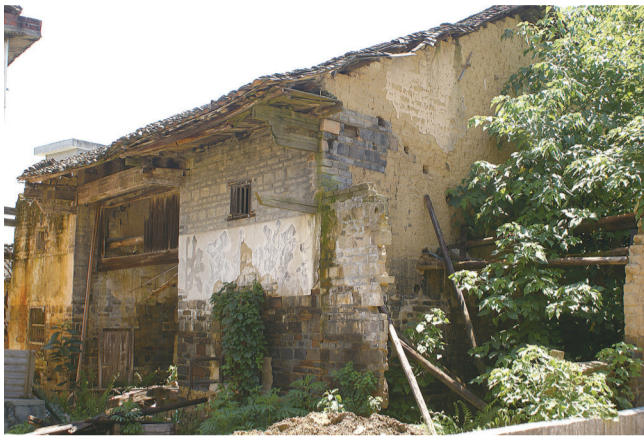
老墟上的霍家大屋

人们贪图方便,下车就在公路边买卖交易,大都不愿意下一个斜坡,到“老霍家墟”上去做买卖。于是,新拓展的炎安(炎陵至安仁)公路,又是县城和省城通往炎帝陵风景区的交通要道,车来车往,人气十分旺盛,公路两边新征收的土地,很快便被远近的老百姓购买建起了两排气派的楼房,一条向炎帝陵方向延伸的衢衢大道也就日渐繁华,霍家墟往日的风光,便骤然转移到新建成的“霍家大道”上,日常聚货交易和逢墟日赶集,人们大多在霍家大道与老霍家墟口的丁字路口连接新农贸市场这一带。但是,三河中学兼收了镇政府的老地盘“霍家祠堂”之后,迅速发展扩大,教学相长,人才兴旺,在一定程度上维护了霍家老墟的热闹。