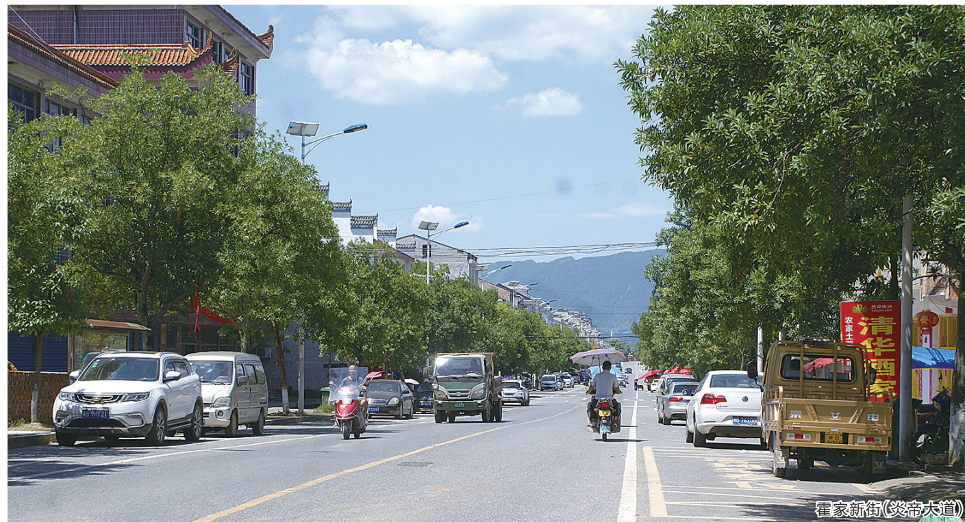
霍家新街(炎帝大道)