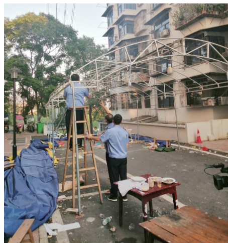
▲执法人员拆除收缴搭建灵棚的相关物件

执法人员称,下一步,他们将加大摸排力度,针对搭棚治丧、活人墓、贵人墓等违规行为,加大整治力度。