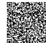
扫码进入建宁优选商城