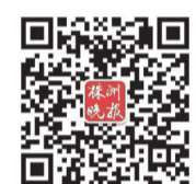
株洲晚报微信公众号